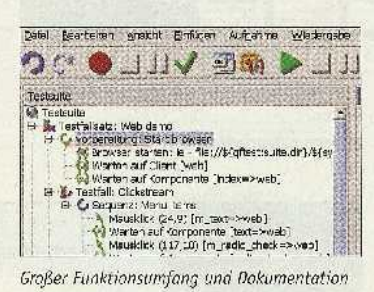
Großer Funktionsumfang und Dokumentation erleichtern das Testen von Web-Projekten.

Bisher auf Tests von Java-Anwendungen spezialisiert, wagt QF-Test jetzt den Schritt hin zum Test von Webseiten. Eine funktional aufgeteilte GUI erleichtert das Entwickeln von Testfallsätzen, innerhalb derer sich alle Test Schritte automatisieren lassen. Ein typischer Testfallsatz beginnt mit der Vorbereitung, in der QI Test den Brow ser öffnet und die zu testende Website lädt. OF-Test unterstützt Internet Explorer (ab 6), Firefox (ab 2) und Seamonkey/Mozilla, An die Vorbereitung schließen sich ein oder mehrere Testfälle an, die wiederum jeweils aus einer Befehlssequenz bestehen. anschließend beliebig oft abgespielt. Vom einiachen Clickstream, bei dem QF-Test in der Website klickt, über das Ausfüllen